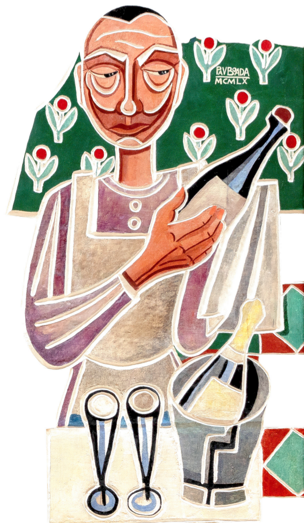
Mural de la vinya i el vi (fragment). Pau Boada, 1960. VINSEUM.

27.11 — 1.12 Priorat, 2024 mostfestival.cat